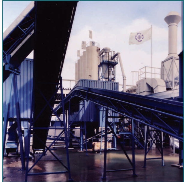
Planta de reciclaje VEKA UT, en Behringen, Alemania

La tecnología de reciclado con la que opera esta planta ha sido completamente desarrollada por VEKA y es un ejemplo del buen hacer, como lo puso de manifiesto la Dirección General XIII de la Comisión Europea (Medioambiente) durante una visita a las instalaciones.